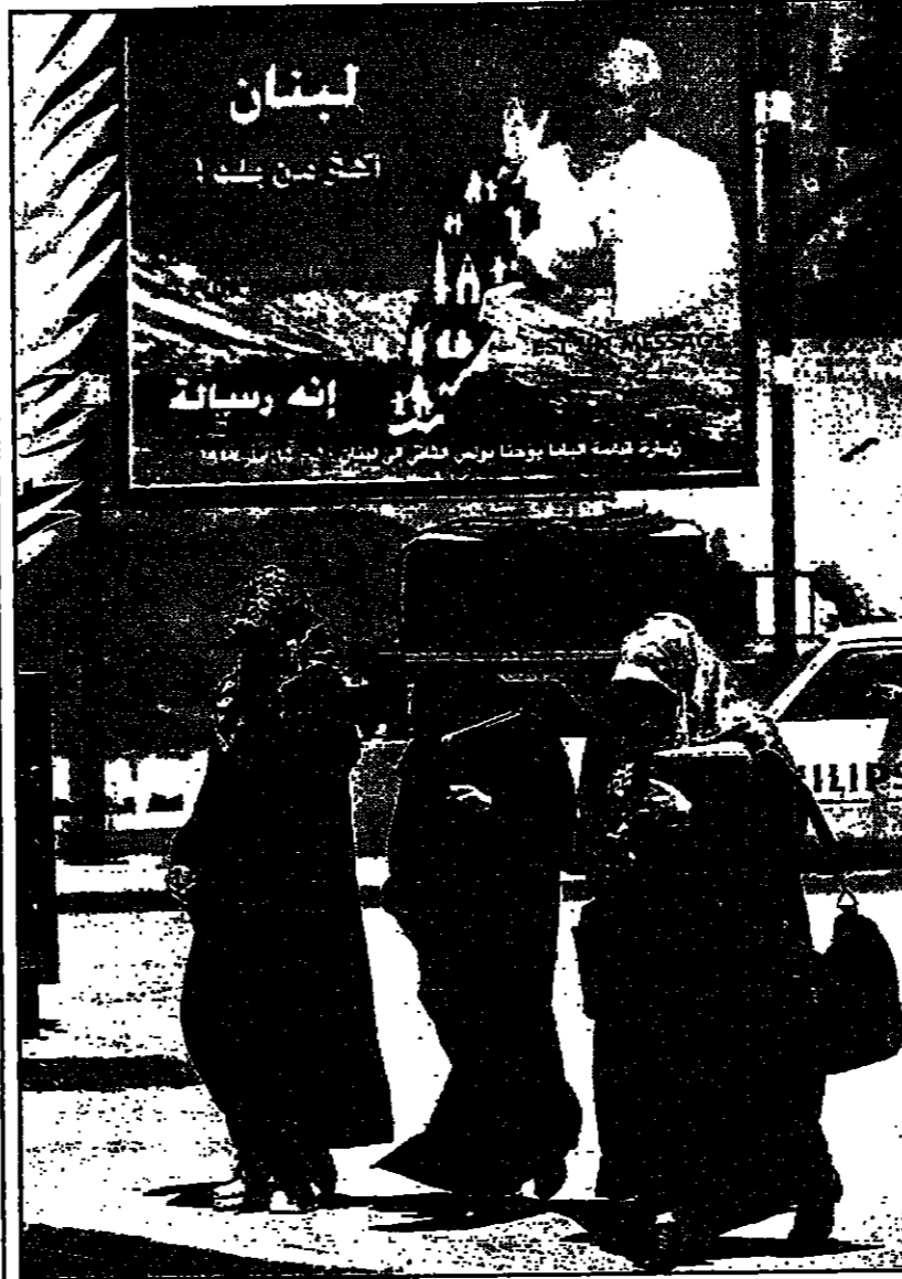
ثلاث لبنانيات محجبات يسرن امام ملصق يرمز بزيارة البابا الى لبنان

بيروت - من انثرو تارنوفسكي: وجهت عائلات المعتقلين اللبنانيين في السجون الاسرائيلية وفي معتقل الخيام (الشريط الحدودي الذي تملكه اسرائيل في جنوب لبنان) الجمعة مذكرة الى البابا يوحنا بولس الثاني بيدي زيارة الى لبنان اليوم السبت، تأسفوا فيها للعمل من اجل اطلاق سراح ابناءهم. وقال مؤلفو المذكرة ماثا تشارنكوفسكي انهم يترقبون نتيجة عمليته على نشر الحجة والسلام بين البشر ان تثال هذه القضية من قبل كل العناية والرعاية فيكون هديك للبيان واللبنانيين الموقوفين في معتقل الخيام ومعتقل الخيام. السجون الاسرائيلية ومعتقل الخيام. والرعاية فيكون هديك للبيان واللبنانيين الموقوفين في معتقل الخيام ومعتقل الخيام.